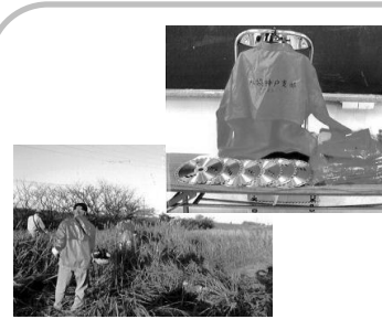
【神戸支部:老人のひろば】

神戸支部では、イベントジャンパー、除草清掃用具を整備しました。社協神戸支部会員を中心に地域の高齢者で環境奉仕グループを結成し、老人のひろば事業で購入した備品を活用して、毎月地域内の雑草狩りや除草、ゴミ収集、草花の植栽等を行い地域の環境美化に努めています。