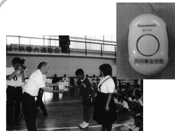
【橘・氷見支部:児童の健全育成】

今回の事業の実施が、子どもたちが挨拶の大切さを見つめなおすきっかけとなり、また社協の啓発にも役立っています。