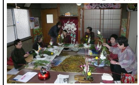
同じ材料でもそれぞれ個性が出ますね。

取材日 12月13日(月) 10:00~ 丹原町来見(中川) 中川さくら保育園の隣りにある庵寺で、信心深い皆さんが庵の清掃後に活動しています。会員の中にお花の先生もおり、普段は季節の花を持ち寄りますが、年末のこの日はお正月用にサンゴミズキ、ストック、ピンポン菊、スプレーカーネーション、アレカを用い思い思いに生けてみます。「右相、左相にこのお花を入れたらかわいらしいね」嵯峨御流の奥義を学び、美しい花を愛で心が落ち着き、より女らしくなります。 生け花の後は手際よく押し寿司を作り、菜の花や紅葉をあしらったお盆になますや黒豆、フルーツ等を美しく盛り付け懐石料理の出来上がり。美しい料理も愛でお腹と心で堪能しました。 また前日は、とうえん祭の餅つきにも参加し底力を発揮したそうです。「落ち込んでいた時期もあったけれど、楽しいことに誘ってくれてうれしいの」と笑顔で語ってくれました。 一足早くお正月が来ました！