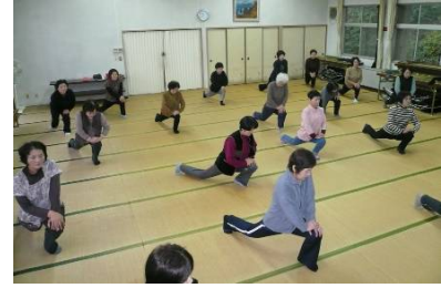
約30分間ゆったりとストレッチ。

取材日 12月7日(火) 10:00~ 洲之内(神戸) 近くに石鏡神社や前神寺があり、社協の指定管理施設にもなっている『老人憩の家』で毎週開催しています。軽快な音楽に合わせた元体操選手指導のテープで、立った姿勢で首、腕、肩、腰、お腹、脚、ふくらはぎ、アキレス腱と順にストレッチしていきます。次は座った姿勢でも凝り固まった筋肉をほぐしていきます。ストレッチすることにより、血管も伸び縮みして強くなり、血液サラサラになるそうです。「体が温かくなり効いてる感じがするわ」と口コミで広がり、会員以外に一般参加の方も多数いるそうです。 「ここに来たら、心のストレッチもできるから楽しみなんよ！」身体をストレッチした後は、前号で藍刈いきいきサロンの方に頂いた、鶴のポチ袋をお手本に作ってみました。折り紙2枚をくっつけて長方形にし、折鶴の要領で仕上げていきます。「赤い紙で熨斗(のし)も作ったらいいね」とアイディアも飛び出しました。一味違った素敵なポチ袋が完成です。お正月に大活躍したことでしょう。