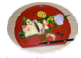
食べるのがもったいない！