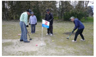
狙いを定め入りますように・・・

「グランドゴルフしたら病気になるけんおいでんよ！」障害をもっている方と賛助会員さんのサロンです。この日は高須運動公園で、吉岡地区のサロン『おはよう会』と軽スポーツで交流です。午前中はパタンクで軽く肩慣らし。お昼は会員さんお二人がちらし寿司と豚汁を作って来て下さり、青空の下みんなで頂き腹ごしらえ。お腹いっぱいになったらグランドゴルフで腹ごなし。4チームに分かれ8ホールを回ります。長い距離は50mもあり一周回ると約1,300歩になるそうです。