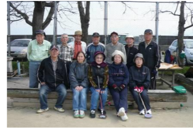
仲間がいるからチャレンジできる！

皆さんサッサッサッと早歩きで、とても大病をしている方には見えません。『チャレンジド』とは障害をもった人のことで、神様から試練に挑戦する使命を与えられた人です。チャレンジできる人だからこそ与えられているのかも・・・と皆さん