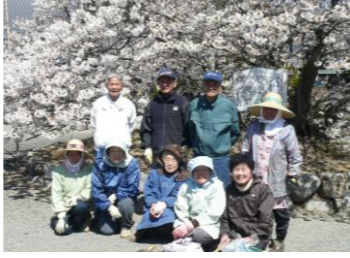
一樹桜の前で、にっこり笑顔

また、庄内小学校の行事『ふるさと探訪オリエンテーリング』では昨年実報寺地区が担当し、史跡の「阿弥陀堂」「皇子社」「亥の子神社」など歩いて巡り、小学生と保護者に説明をしたそうです。事前にサロンで庄内村誌を用いて資料を作成し、あらためて地元の歴史・文化を再認識したとのこと。先人から受け継いだ宝を守り、未来に繋げることは大切ですね。