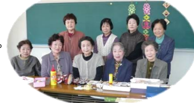
手づくり大好き☆何でもござれ！

古い着物を壊した時、みんなで分け合いパッチワークのポーチを作ったり、あり合わせの布やブラウスを再利用してお手玉を作り布に新しい命を与えます。お手玉やポケットティッシュケースは簡単にできるのでたくさん作り、地域の福祉施設の利用者さんにプレゼントして大変喜ばれたそうです。また、老人会と多賀小学校の新一年生が昔の遊びで交流する予定で、サロンでもお手玉を数