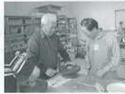
【説明を聞く受講生】

“陶芸を通し、高齢者や障害者と交流を深めてもらおう”と『陶芸ボランティア講座』を北地域交流センターで開催しました。陶芸という題材の親しみやすさからたくさんの方が集まりました。今後、陶芸ボランティアとして活躍されることを期待しています。