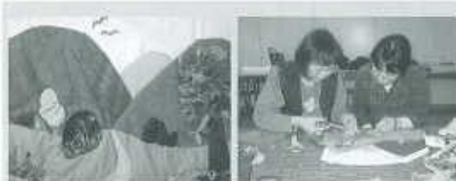
【布の絵本を作りました】