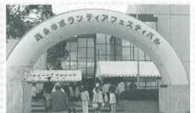
第1回ボランティアフェスティバルより

今年もたくさんのボランティアさんにご協力をいただいて、楽しいフェスティバルになるよう準備をすすめています。どうぞお気軽にお越しください。なお、フェスティバル参加団体を募集しますので、お問い合わせください。