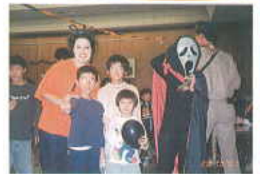
ハロウィーンパーティー