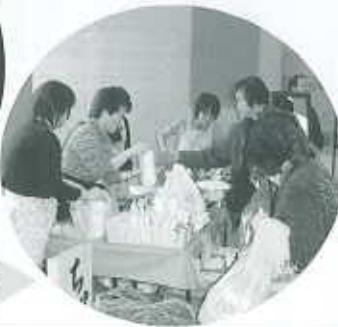
施設、作業所の皆さんのバザーは、大盛況！！