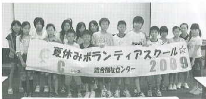
Cコース：総合福祉センター（24名） 8月3日～8月6日