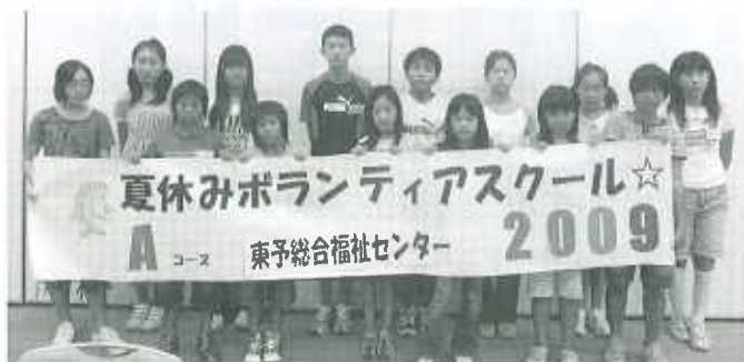
Aコース：東予総合福祉センター（18名） 7月27日～7月30日

4日間の日程の中で、手話や点字などのボランティア体験、また高齢者疑似体験、車イス体験などを行いました。また今年度は2年ぶりに知的障害者との交流を取り入れ、道前育成園利用者の方と楽しく交流しながら障害について学習しました。