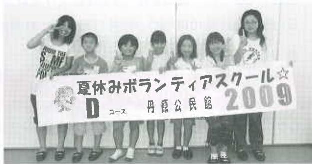
Dコース：丹原公民館（8名） 8月3日～8月6日