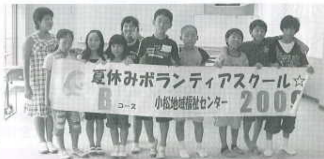
Bコース：小松地域福祉センター（11名） 7月27日～7月30日