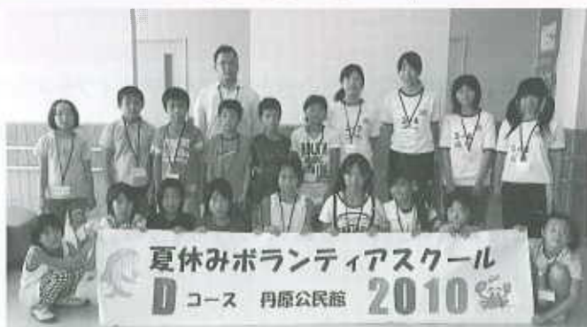
Dコース：丹原公民館（20名） 8月3日～8月6日