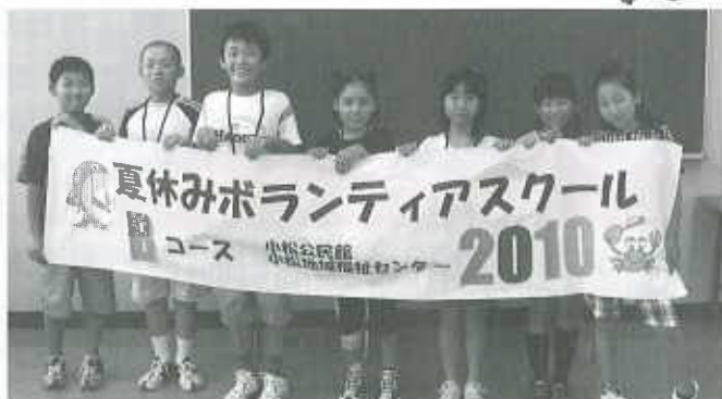
Bコース：小松公民館/小松地域福祉センター（9名） 7月27日～7月30日