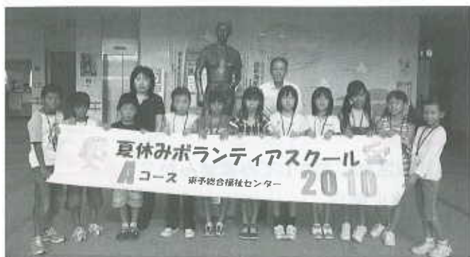
Aコース：東予総合福祉センター（12名） 7月27日～7月30日