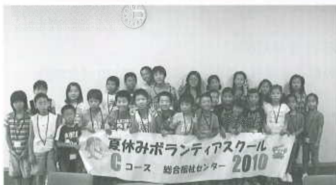
Cコース：総合福祉センター（30名） 8月3日～8月6日