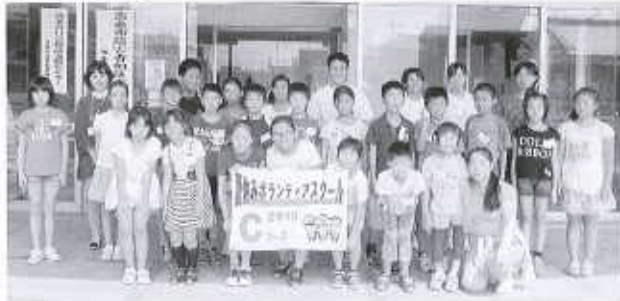
Cコース：東予総合福祉センター(28名) 8/4～8/7