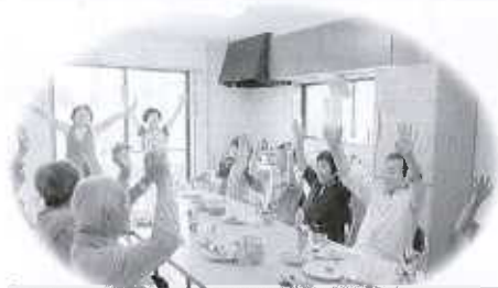
ふれあい・いきいきサロン