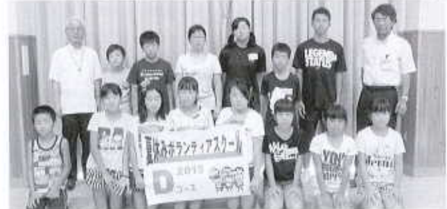
Dコース：丹原公民館(15名) 8/4～8/7