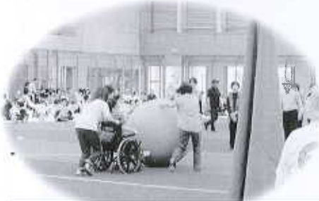
ふれあいの運動会