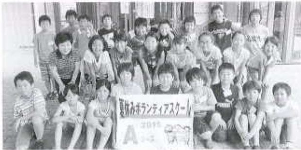
Aコース：総合福祉センター(25名) 7/28～7/31