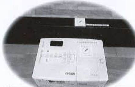
共同募金配分金特別事業

皆様からご協力いただいた赤い羽根共同募金は、これらの事業の他にも、障害者社会参加促進事業や、ボランティアセンター運営事業など、西条市をよくする活動に活かされています。