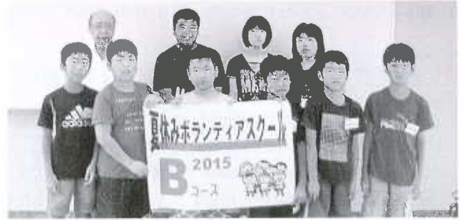
Bコース：小松地域福祉センター(8名) 7/28～7/31