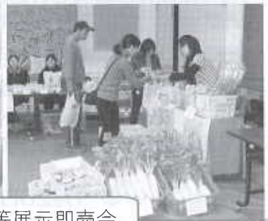
福祉施設等展示即売会