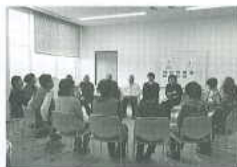
【ボランティア講座】

福祉育成・援助活動費 ・支部社協育成事業 ・ふれ愛シネマ事業 ・共同募金広報事業