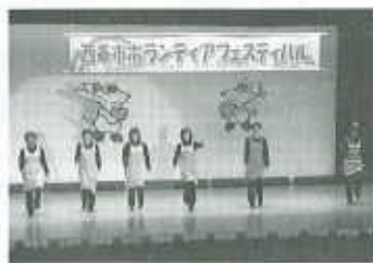
【ボランティアフェスティバル】

児童・青少年福祉活動費 ・児童の健全育成事業 ・少年式行事助成事業 ・中学校卒業就職者激励事業