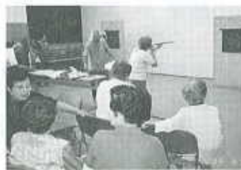
【老人のひろば事業】