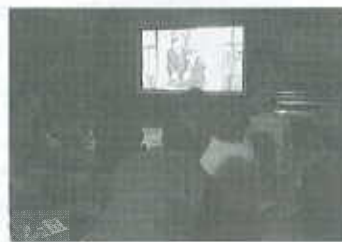
【ふれ愛シネマ事業】