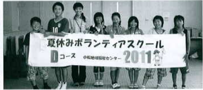
Dコース：小松地域福祉センター（7名） 8/9～8/12