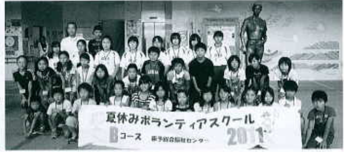
Bコース：東予総合福祉センター（35名） 8/2～8/5