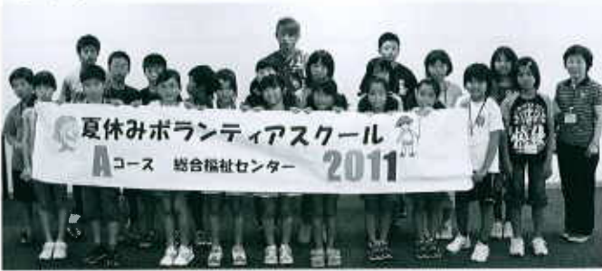
Aコース：総合福祉センター（23名） 8/2～8/5

点字や手話、朗読などのボランティア体験の他、今年は、災害についての学習も取り入れ、東日本大震災の被災地（宮城県女川町）へ応援メッセージを送りました。真夏のスクールで子供たちの楽しく和やかにそして真剣に学ぶ姿が見られました。