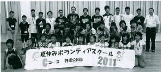
Cコース：丹原公民館（32名） 8/9～8/12