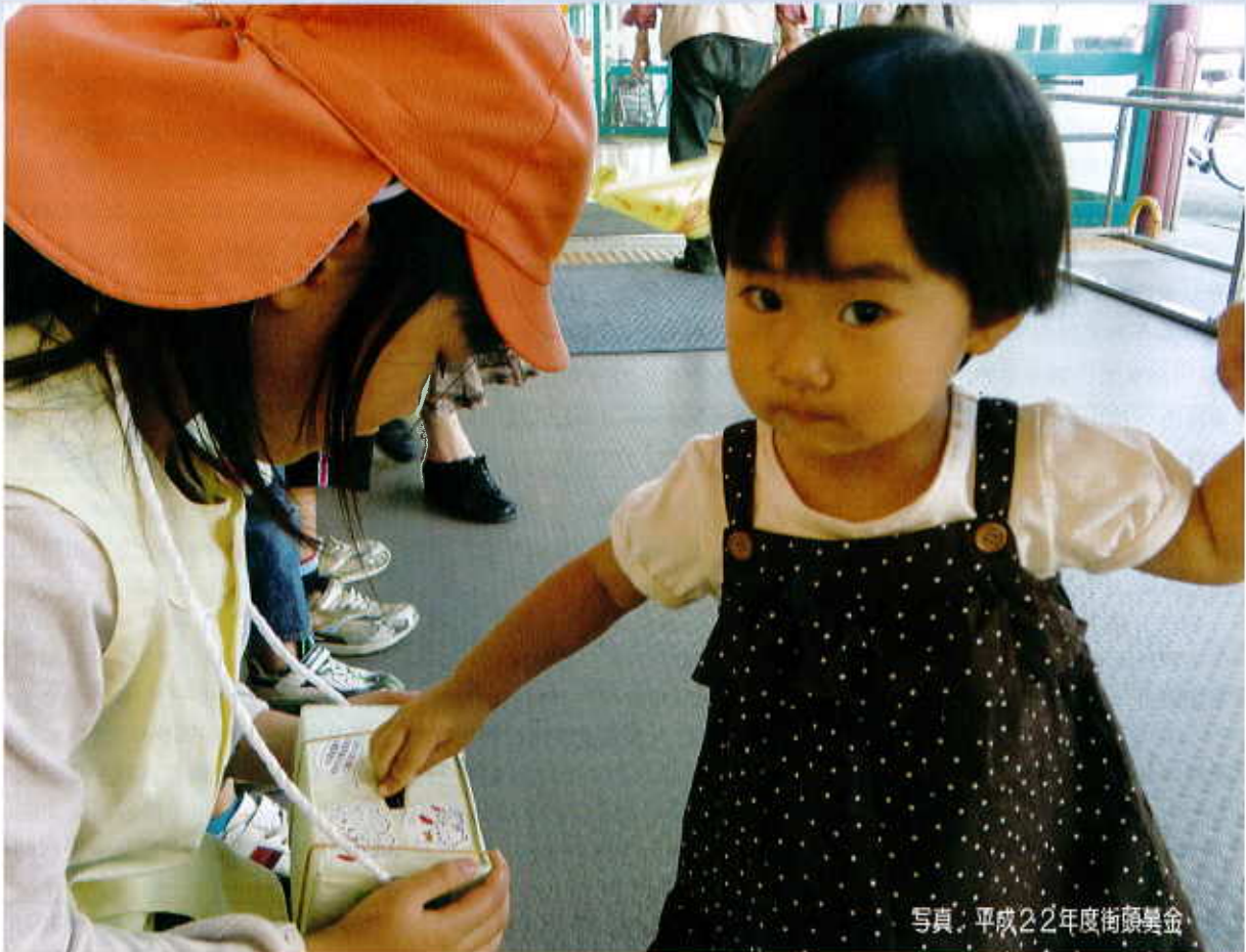
写真：平成22年度街頭募金

赤い羽根共同募金は、高齢者、障害者、子どもたちなどへの、地域の福祉活動を支援する募金です。災害時には、「災害ボランティアセンター」の設置や運営など、被災地支援にも役立っています。