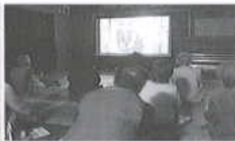
【ふれ愛シネマ事業】