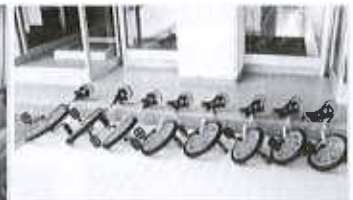
【児童の健全育成事業】