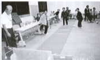
【老人のひろば事業】