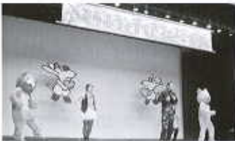
【ボランティアフェスティバル】