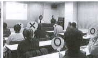
【ボランティア講座】